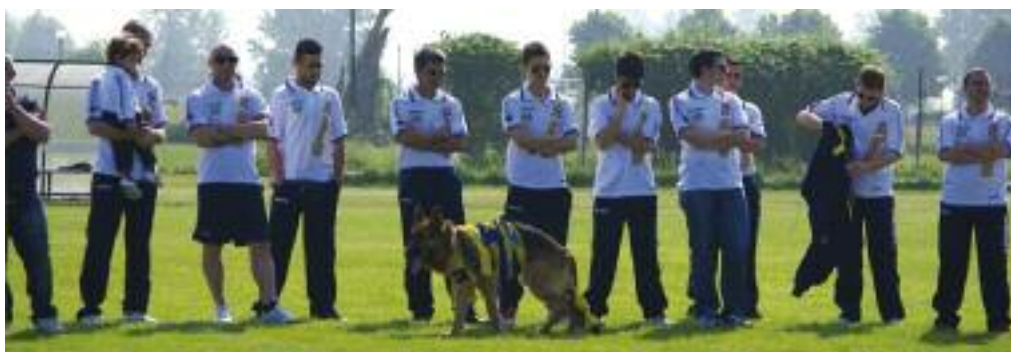
... ai più grandi