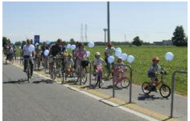
Biciclettata "Più pedali più bevi"

che gestisce il servizio idrico di Dresano) hanno parlato del valore dell'acqua come bene primario e della sua importanza come bene comune e soprattutto della cura e del rispetto che ne dobbiamo avere perché è un bene troppo prezioso e non può essere sprecato. Di ricordi d'acqua hanno parlato anche i ragazzi della scuola Don