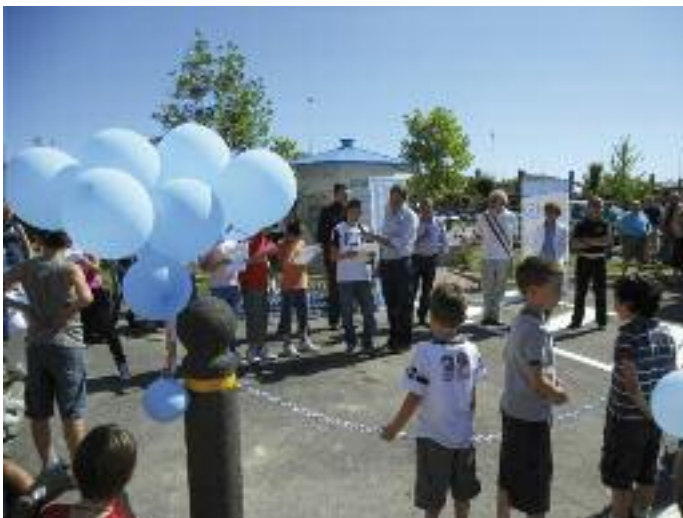
Gli alunni della scuola Don Milani all'inaugurazione

Alla festa hanno partecipato moltissime persone: bambini, ragazzi, mamme, papà e nonni! I genitori dei bambini delle scuole dell'infanzia, hanno organizzato una simpaticissima triciclettata colorata d'azzurro sotto lo slogan "più pedali più bevi". A conclusione del pomeriggio una gustosa merenda per tutti e naturalmente un bel bicchiere di buona, sana e fresca ..... ACQUA !!!!!