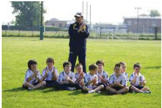
Dai più piccoli...

Che dire, è stato un mese faticoso ma ricchissimo di soddisfazioni per tutti e di divertimento per i nostri ragazzi, e tutto ciò che la Soc. Dresano Calcio fa, lo fa per loro: i ragazzi di Dresano, per dare la possibilità a tutti di frequentare il Centro Sportivo, di stare insieme con gli amici, andare tutti insieme in gita dove ci pare, organizzare la festa di Natale con i regali a tutti nostri bimbi, imparare uno sport, imparare sia a vincere che a perdere, imparare le regole, che, sia nel calcio che nella vita servono a formare l'uomo di domani.