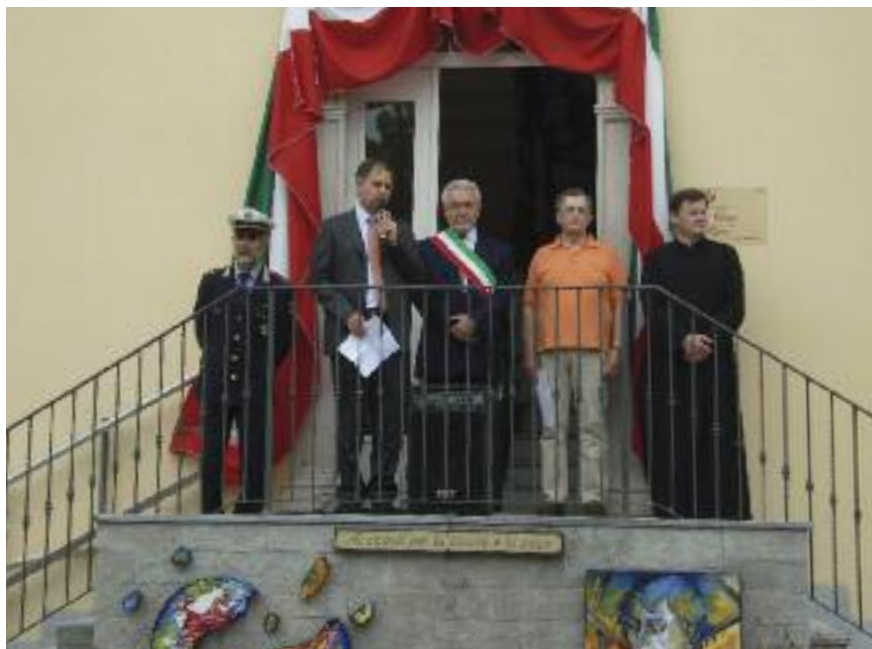
2 Giugno Festa della Repubblica

La mostra "150° Unità d'Italia" inaugurata il 27