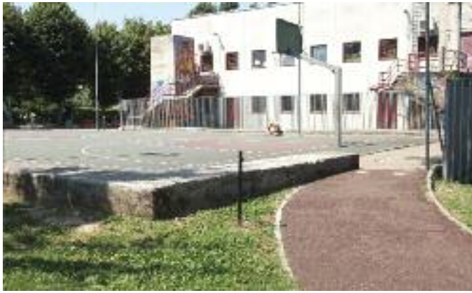
Cestino e archetto passaggio pedonale: asportati

vera inoltrata dove l'effetto combinato pioggia/sole fa crescere molto più in fretta l'erba nei giardini e basta un piccolo ritardo nel taglio per dare l'impressione di non ricevere un servizio adeguato. In realtà tutto si sistema non appena le condizioni meteo permettono all'impresa di intervenire.