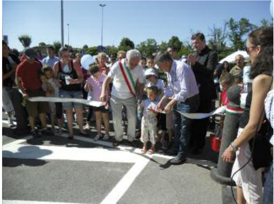
Taglio del nastro

U n bel pomeriggio di sole ha accompagnato la festa per l'inaugurazione della casa dell'acqua: una moderna fonte che eroga acqua di ottima qualità, costantemente controllata e che fornisce occasione di socializzazione: un chiosco adiacente a piazza Europa da dove, dalle 7,30 alle ore 21,30, si può prelevare acqua naturale e frizzante. L'acqua distribuita è quella che proviene dall'acquedotto comunale in più è sottoposta alla sterilizzazione a raggi ultravioletti. L'acqua è stata, naturalmente, la protagonista della festa e di acqua hanno parlato le autorità presenti. Il Sindaco, il Parroco e il Presidente della Cap Holding (la società