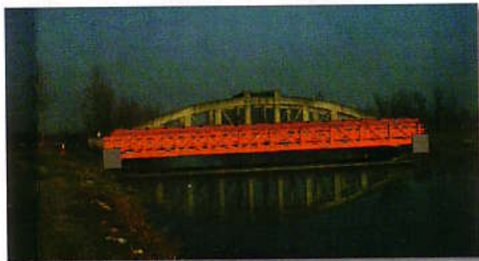
Pista Ciclabile Dresano - Villa Pompeiana: Ponte sulla Muzza.

Partono finalmente i lavori per la realizzazione della tanto attesa pista ciclo pedonale di collegamento tra Dresano e Balbiano. Dopo l'arrivo delle autorizzazioni di Provincia di Milano e Parco Sud, è stata infatti espletata la gara di assegnazione dei lavori che potranno così partire e completarsi entro pochi mesi. La pista ciclabile verso